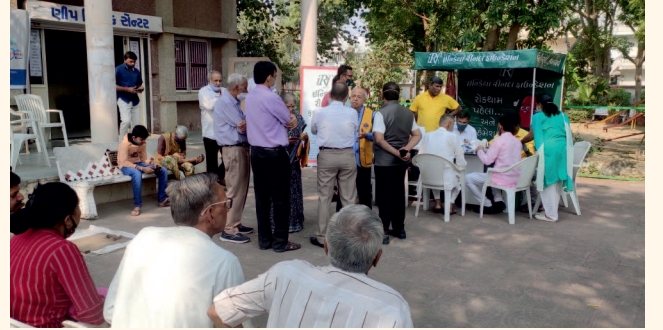
મેઘા કેમ્પમાં ભાગ લેતા નાગરિકો

તારીખ ૧૪ નવેમ્બર વિશ્વ ડાયાબિટીસ દિવસ તરીકે ઉજવવામાં આવે છે જેનો હેતુ ડાયાબિટીસથી શરીરના અન્ય અંગો પર પડતી વિપરીત અસરથી સમાજના લોકોને જાગૃત કરવાનો છે. જેને ધ્યાનમાં રાખીને આ દિવસે ઈન્ડિયા રીનલ ફાઉન્ડેશન, લાયન્સ ક્લબ ઓફ શાહીબાગ અને સદવિચાર પરિવારના સંયુક્ત ઉપક્રમે એક વિશેષ મેઘા મેડિકલ ચેકઅપ કેમ્પનું આયોજન અમદાવાદના રાણીપ વિસ્તારના લોકો માટે રાણીપ સાર્વજનિક પુસ્તકાલય ખાતે કરવામાં આવ્યું હતું. જેમાં ભાગ લેનાર દરેક વ્યક્તિનું બીપી, ડાયાબિટીસ, કિડની અને આંખોની તપાસ કરવામાં આવી હતી.