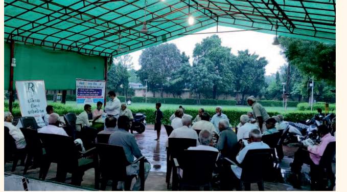
સિનિયર સીટીઝન ક્લબ, ડીસા