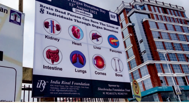
મુખ્ય ચાર રસ્તાઓ પર મૂકવામાં આવેલ હોર્ડિંગ્સ

આ કાર્યક્રમનું આયોજન કરવા પાછળનો મુખ્ય હેતુ અંગદાનની પ્રક્રિયામાં શ્રેષ્ઠ વ્યવસ્થાપન અને સંકલન થઈ શકે અને કેટેવેરિક અંગદાનના પ્રમાણમાં વધારો થાય અને અંગદાન પ્રતિક્ષા યાદી ધટાડવાનો છે જેથી જરૂરિયાતમંદ દર્દીઓને યોગ્ય સમયે અંગ મળી રહે.