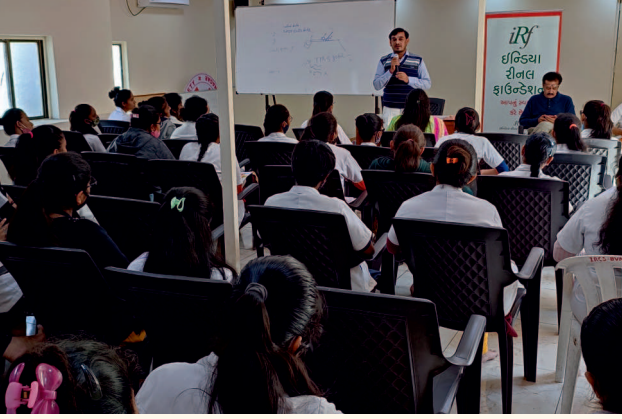
અકવાડા ગુરુકુળ નર્સિંગ કોલેજ, ભાવનગર