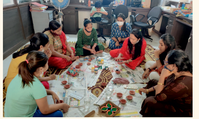
ઈવા બનાવવાની તાલીમમાં ભાગ લેતા પ્રેરણા સભ્યો