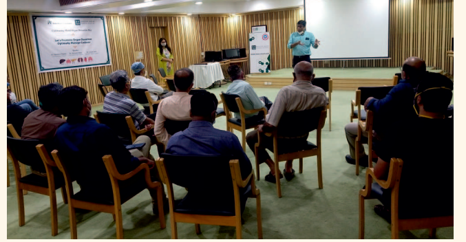
ભાઈલાલ અમીન હોસ્પિટલ ખાતે વર્કશોપ