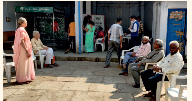
નવરંગપુરા ગામ, અમદાવાદ

ડાયાબિટીસની કિડની અને શરીરના અન્ય અંગો પર પડતી ખરાબ અસરો વિષે લોકોને જાગૃત કરવાના ભાગરૂપે સંસ્થા દ્વારા લાયન્સ ક્લબ ઓફ શાહીબાગ અને લાયન્સ ક્લબ ઓફ અમદાવાદ સંવેદનના સહયોગથી શહેરના સ્લમ વિસ્તારો અને ગામડાઓમાં ડાયાબિટીસ અને બીપીના નિદાન કેમ્પ કરવામાં આવી રહ્યા છે જેમાં ડાયાબિટીસ અને હાઈબ્લડપ્રેશરના દર્દીઓને માહિતી પુસ્તિકાઓ સાથે માર્ગદર્શન પણ આપવામાં આવે છે.