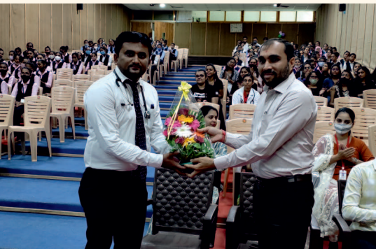
ડો. જીનેશ પુરોહિતનું સ્વાગત કરતા કોલેજના અધ્યાપકશ્રી

અંગદાન દિવસે સુરત ઓલપાડ ખાતે આવેલી શ્રી સ્વામિનારાયણ એજ્યુકેશન ટ્રસ્ટ સંચાલિત વાયબ્રન્ટ નર્સિંગ કોલેજના વિદ્યાર્થીઓને અંગદાન વિષે જાગૃત કરવા તેમજ હોસ્પિટલમાં ફરજ બજાવતા નર્સિંગ સ્ટાફની કેડેવર અંગદાનની પ્રક્રિયામાં શું ભૂમિકા હોવી જોઈએ તે વિષેની સમજ આપવા માટે ડો. જીનેશ પુરોહિતને (નેફ્રોલોજિસ્ટ) આમંત્રિત કરવામાં આવ્યા હતા. જેઓએ પ્રોજેક્ટરના માધ્યમથી આ વિષયની સમજ વિદ્યાર્થીઓને આપી હતી. આ દિવસે કોલેજની વિદ્યાર્થીનીઓ દ્વારા અંગદાન વિષે જાગૃતિ લાવવાના ઉદ્દેશ્યથી ખાસ નાટક અને ચિત્ર સ્પર્ધાનું આયોજન કરવામાં આવ્યું હતું જેમાં વિજેતા વિદ્યાર્થીઓને કાર્યક્રમમાં ઉપસ્થિત ડો. જીનેશ પુરોહિતના હાથે ઈનામ આપીને પ્રોત્સાહિત કરવામાં આવ્યા હતા. શ્રી સ્વામિનારાયણ એજ્યુકેશન ટ્રસ્ટ દ્વારા IRF ને રૂ. ૫૦૦૦/- નું દાન મળેલ છે. તે બદલ અમે તેમનો હૃદયપૂર્વક આભાર માનીએ છીએ.