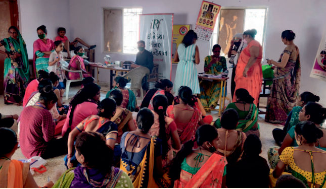
વિરમઠા ગામ તા. દાસકોઈ જી. અમદાવાદ