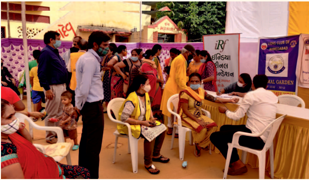
કેમ્પમાં ભાગ લેતા ચામુંડાનગર સોસાયટીના નાગરિકો

આ કેમ્પમાં રાણીપ વિસ્તારના લોકોએ બહુ મોટી સંખ્યામાં લાભ લીધો હતો. આ કેમ્પનું આયોજન કરવા પાછળનો હેતુ ડાયાબિટીસની શરીરના અન્ય અંગો પર વિપરીત અસર પડે એ પહેલા તેનું નિયંત્રણ અને સારવારનું મહત્વ લોકોને સમજાવવાનો હતો.