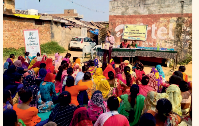
સાધી ગામ તા. પાદરા, જી. વડોદરા