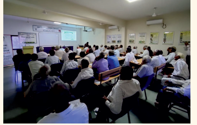
ખેડૂત તાલીમ કેન્દ્ર, મહેસાણા