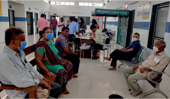
વડસર ગામ તા. કલોલ, જી. ગાંધીનગર