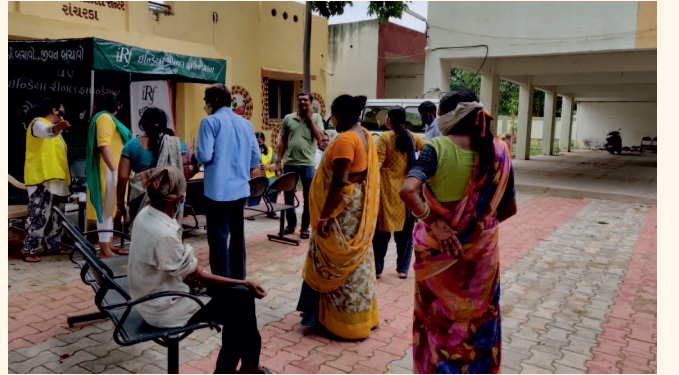
રાંચરડા ગામ તા. કલોલ, જી. ગાંધીનગર