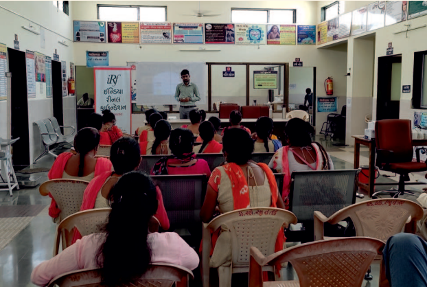
ધાનોરી ગામ તા.ગણદેવી જી. નવસારી