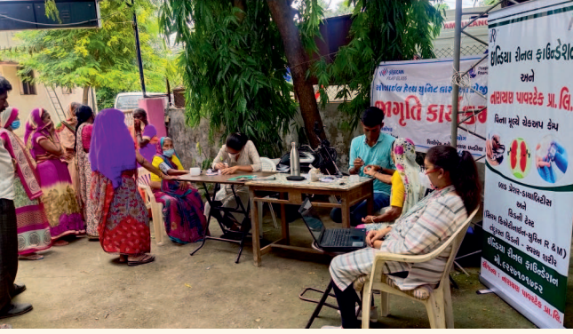
કાલોલ ગામ, તા. કાલોલ, જી. પંચમહાલ