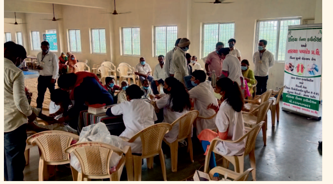
ગાયત્રી મંદિર, હાલોલ, જી. પંચમહાલ